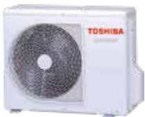
Vanjska jedinica (simbolična slika)

Tihi režim rada za vanjsku i unutarnju jedinicu